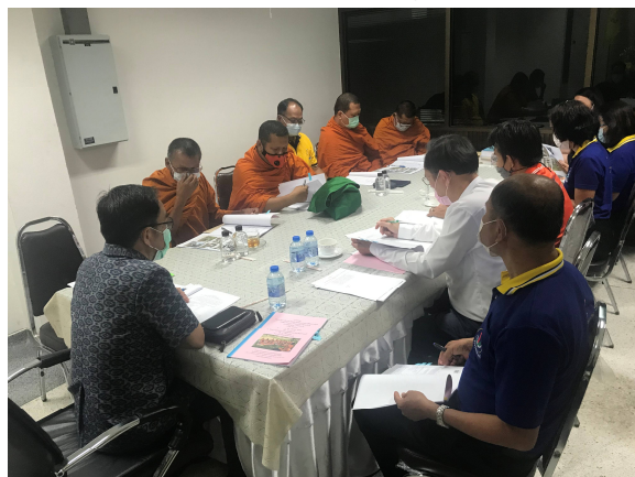
การประชุมรับฟังความคิดเห็นจากผู้มีส่วนได้ส่วนเสีย